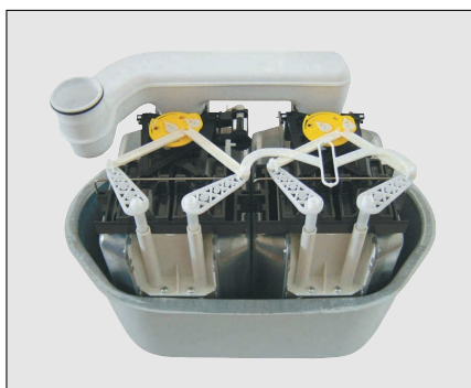
Merací mechanizmus plynomera BK-G25