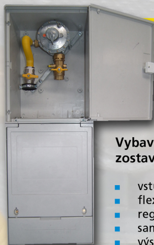
S 2300 STL DRZ STL s HUP + regulátor