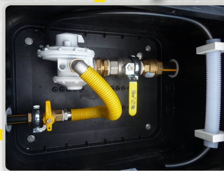
Zemný modul ME4 S