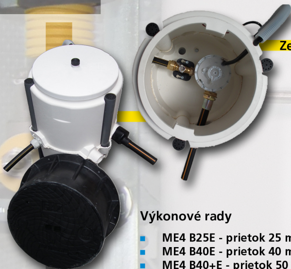
Zemný modul ME4