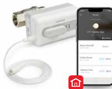
Resideo Braukmann L5 Wi-Fi uzatvárací ventil – ochrana pred únikom vody