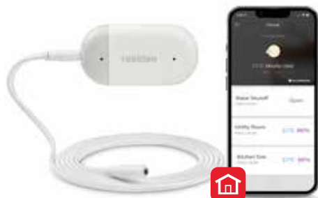
Resideo Braukmann L1 Wi-Fi detektor úniku vody a mrazu

Tieto výrobky poskytujú zákazníkom väčší pokoj a upozorňujú ich na netesnosť alebo zamrznutie potrubia. Funkcia automatického uzatvárania ventilov navyše znižuje rozsah potenciálnych škôd v domácnosti. Všetko sa dá ovládať prostredníctvom smartfónu cez aplikáciu Resideo, čo je obľúbené riešenie pre dnešných technicky zdatných majiteľov domov.