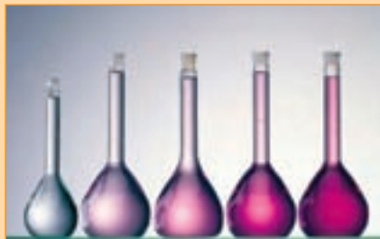
BIONIBAL obsahuje špecifickú prísadu na sledovanie koncentrácie, ktorou je možné overiť či bol vykurovací systém ošetrený správnym množstvom prípravku. Používa sa na to tester BIONIDOSE.