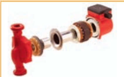
BIONIBAL výrazne znižuje riziko usadzovania kotlového kameňa na citlivých častiach kotla, najmä na čerpadle a výmenníku - maximálna ochrana systému.