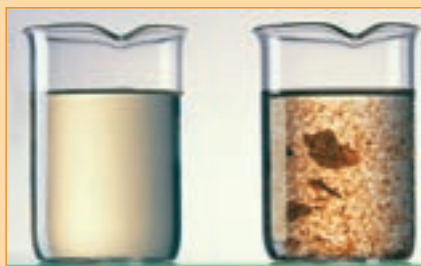
Voda s BIONIBALom zostáva čistá