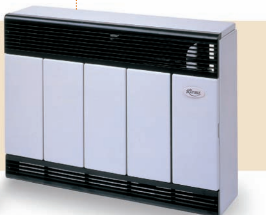
BETA 5 Classic