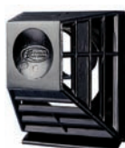
Vonkajší krycí kôš vývodu kachiel

Podokenné konvekčné kachle radu BETA Classic majú vyvedený odvod spalín cez stenu. Svojimi funkčnými vlastnosťami sú naprosto zrovnateľné s ostatnými spôsobmi vykurovania. Kachle BETA Classic sú vhodné do každého interiéru. Obsahujú moderné regulačné prvky, majú vysokú účinnosť a nízke zriaďovacie náklady. Sú ideálne pre vykurovanie rodinných domov, chat, obchodov i kancelárií. Predovšetkým v chatách oceníte, že kachle BETA Classic odolávajú teplotám pod bodom mrazu bez vplyvu na ich funkčnosť.