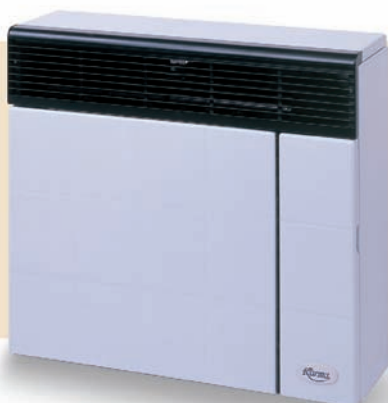
BETA 3 Classic