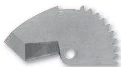
IVAR.ROS C 40