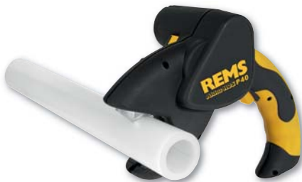
IVAR.ROS P 40 SET