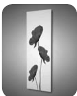
Variant s potiskom Príplatok +150 EUR (typ 1206/456) Príplatok +190 EUR (typ 1806/608)