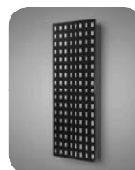
Variant s perforáciou príplatok +80 EUR