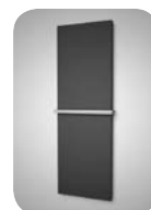
Variant s madlom Príplatok za madlo dĺžky telesa viz. cenník str. 15