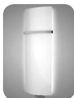
Variant s LED osvetlením Príplatok za LED osvetlení biele +330 EUR Príplatok za LED osvetlení RGB +390 EUR