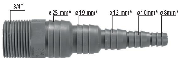
Obj. č. 50017SN