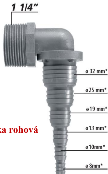
Závitová přechodka rohová Obj. č. 50018SW