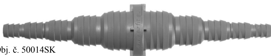
Obj. č. 50014SK