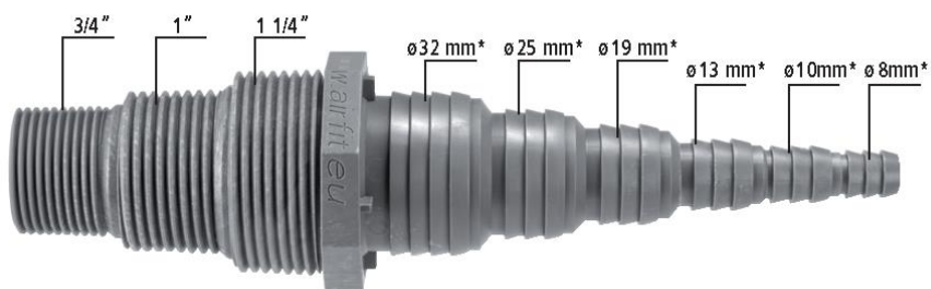
Obj. č. 50019SN