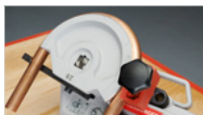
Kované hliníkové segmenty s označením ohybového oblúka