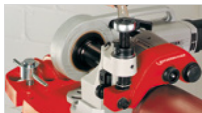
Kompatibilné s Rogroover 1- 6"