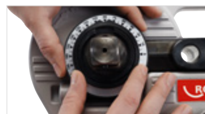
Predbežné nastavenie uhla ohybu bez použitia nástrojov