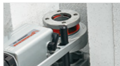
Možno použiť aj v stiesnených priestoroch