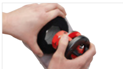
Jednoduché zasunutie závitoreznej hlavy (Speed-Lock)