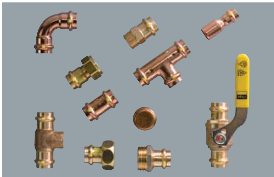
Obr. G – 4

Speciální spojky, příruby a armatury z červeného bronzu nebo mosazi